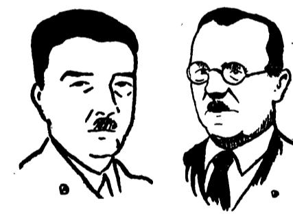
פאזו צ'אקמאק — ראש המטה הטורקי