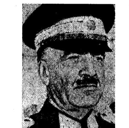
נשיא טורקיה עצמת אינונו