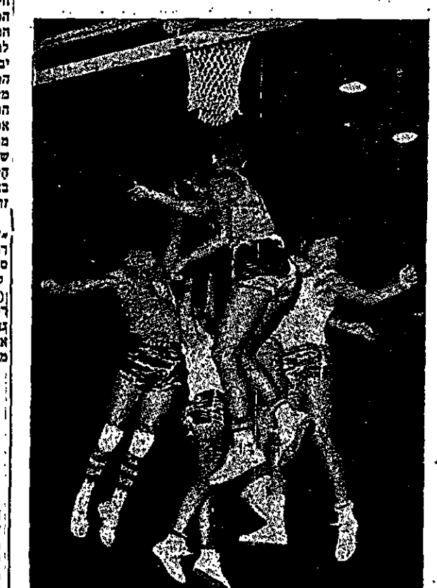
קרב מתחת לסל הפיליפיני במשחק נגד ברזיל (63:99)