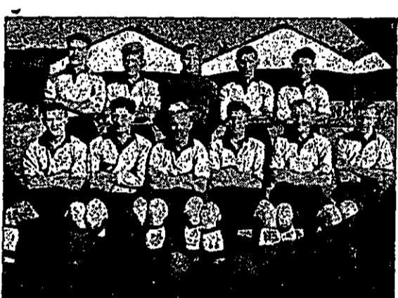
מסחאל: קבוצת וולבס (טוף בעמוד 4)