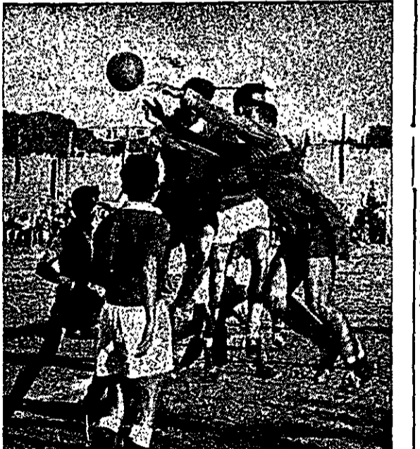
קרב סוער בין „הפועל” חיפה ו„הפועל” ירושלים, במשחק חצי-הגמר על „גביע מצלר” שנערך בחיפה (1:0 לטובת „הפועל” חיפה).

קבוצת „מכבי” פתחה תהליך למישור הצי”ש, ש”חיררה” את שחקניה ויצרה אגודה חדשה בשם „מכבי ע”ן-גנים” - על-ידי גודע אמש, דלתכנו ממקור מוסמך. הדעושו באומן אישית הרי עם מליוי טוסט השחור הרשמי, התחום על ידי אגודתם. יבולים השחקנים לעבור לכל אגודה רצויה להם.