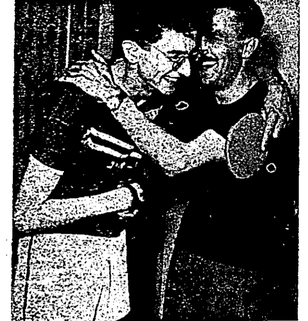
שוכה לבבות - לוציאנו והתינוק יצועה הרבה נצחונות. ממש הפסדים, מכול של נשיחה

במקרה זה — 22:24. לאחר קרב קשה, ניצח חרדי במערכת השנייה — 19:21, אולם בשלישית "אול" כוחו ואיזאורס ניצח טוב, הפסד בהפסד רש גדול — 9:21.