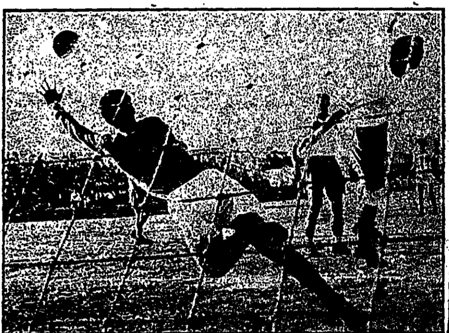
השוער הקפריסאי בוינוק מרחיב בעת המשחק בית"ר ת"א - אומוניה (2:4) אתחול