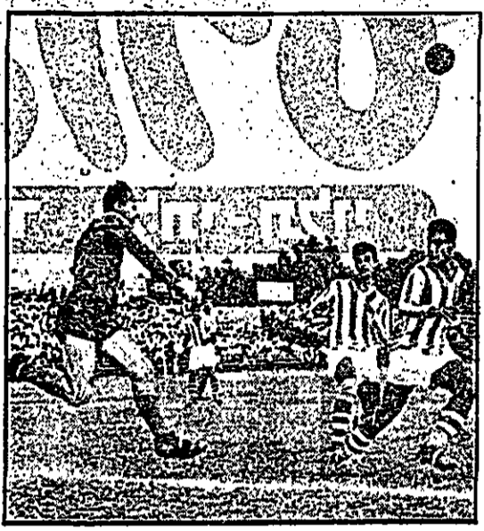
בנדורי הודף כדור באגרופו כשרצבי ואמואר פורצים

כיום הצדדים לא נראה באפשר להשיג רוח הליחה שגמלה הקי בזה האסורה נגדה לה ירדעו במינימים ובסידור עבד אי ענין של התרובות במסגרת הסדרות היה זה את ההשקפה האמיתית ליום לבני דרך שבת הביטוי כיצד וזהו למינים קבוצה ליה ב בתולות להפטר בניני קבוצה ליה או בתולות המהווה המספר.