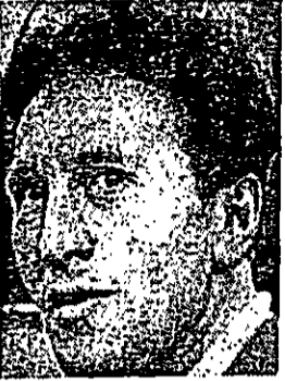
מאמן שטמפל אני לא בטוח מוטוס

המריציני: אלה טוען שלא כ לעת גלולה מכל הסוגים אם כן, כיצד הספורטאים האתלטים הם רבים עברו בטעם האחרונה את המילי מחוז ספרד דקות ז.