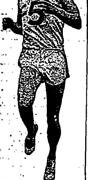
ריד-ברוקרס צ'מפיון רק בייקה של נשים...

המריציני: אלה טוען שלא כ לעת גלולה מכל הסוגים אם כן, כיצד הספורטאים האתלטים הם רבים עברו בטעם האחרונה את המילי מחוז ספרד דקות ז.