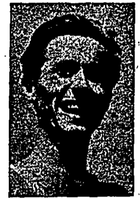
נגדו הטיבה לקריות זו מצד הקהל, לא פורטמה מעל גבי העינות, אולם ספורטאי הונגרי שהחליט לא לחזור למולדתו יחס להסביר יחס זה מנקודת מבט מעניינת:

אחד הספורטאים שנמלט, ולא נחזר פני ההבטחות ומתח הגענועים, היה הרץ המחולל, בעל שיאי העולם, שאנדרו אי- הרש לאחר ששלי- חיס בלתי-רשמיים מחונגריה באו עמו במגע, בעת שחזרו ב- בריסל. החליט לחזור לבודאפשט, ואמנם, כך עשה. בהגיעו ל- עיר הולדתו קבלוהו המוני מעריציו בעין יפה, אולם דעת ה- קהל הכללי הייתה