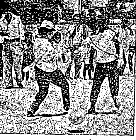
הואללה שאת לא גבר! אמרה כאחד הי ימים נערת הפרבר הפתח-תקוהי מתחיהיהודה אל רעותה, "בואי נשחק גם אנהנו כדורגל". והן היו גבריים, ביקשו את אחד ההותחיים בשמונה לארגן לתן תחרויות. הוא אירגן והתוצאה בו בורה ניר מענין ומשעשע, על מגרש מיוחד, בו ניצחה קבוצת הבנות של מחנה-יהודה את קבוצת שטבי אחים בשיעור 1:0. בתמונה: משחק הגמר.