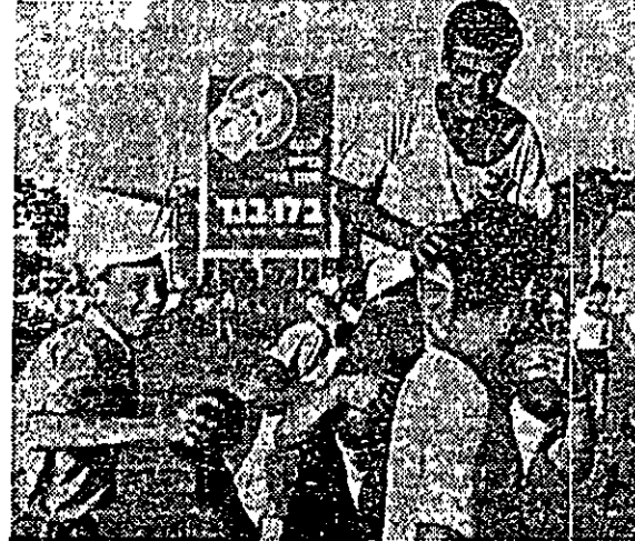
שמחת הנצחון של קבוצת מכבי רמלה