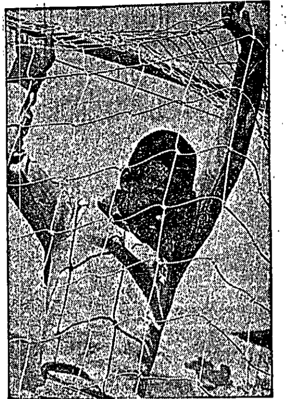
פלה - מקום בטוח...

מחקי מבחן עם האלומה במחוז... דרום ב' 0.6 ג' נספציות.