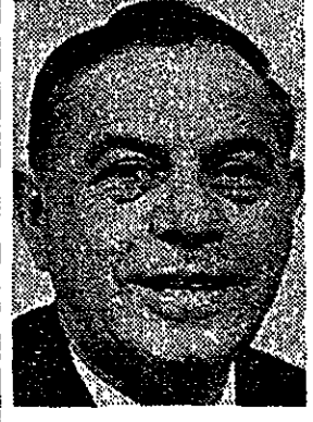
שמעון כספי שר הפנים

האם הוא באמת כה רגוע כפי שהוא נראה? - קשה לומר ש-אפשר להיות היום שקט. צוות אנשי הועדה המארגנת עובד ב-התנדבות. אחת אין בעיות. אבל במוסד ציבורי כמו מכבי, אתה יודע מה קורה. כל אלה אשר חייבים לקבל משכורת, אינם מ-כירים את הועדה המארגנת. הם מכירים את שמעון כספי. והם באים אלי כדי לקבל את שכרם. ומה עושים כאשר הקופה אינה מלאה? כיצד אפשר אז להיות רגוע ושלוו? וכי אישך יודע כי המכביה הקודמת נסתיימו בג-רעון. אף היא - אך לקראת לוחו - קצת אי-נעימות בענינים כ-סיים".